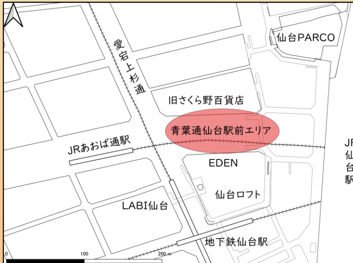
仙台市地下鉄南北線・東西線「仙台駅」北1出口ほかすぐ